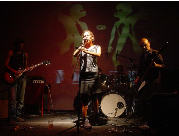
The Inpepateds Live @ Anti MTV Day 2009 - XM24 Bologna

The Inpepateds hanno uno spirito punk e sono profondamente legati al mare.